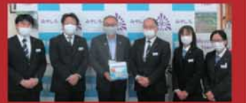
前回お届けにあがった際の様子。宮代町長と弊社スタッフ。▲