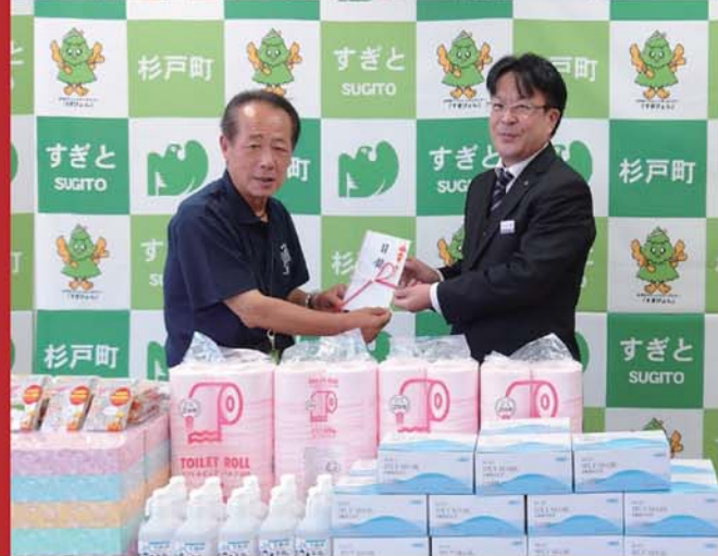
杉戸町長と弊社スタッフ。

当社が地域の皆様に未使用のマスクのご寄付を募ったところ、おかげさまで沢山のマスクやトイレットペーパー等の日用品をお届けいただきました。お預かりしたマスク等は、7月13日(火)に宮代町役場に、7月19日(月)に杉戸町役場に、責任を持ってお届けいたしましたことを報告させていただきます。皆様のご厚意に心から御礼申し上げます。今後もレイエム聖殿では、こうした取り組みを継続してまいります。地域の皆さまにおかれましては、引き続きご理解とご協力をいただけましたら幸いです。