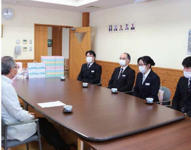
宮代町長と弊社スタッフ。